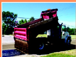
Aplikácia piesku na zreagovanú emulziu CRF