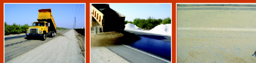
Na zreagovanú emulziu sa nanesie piesok, ktorý je potom vpracovaný do povrchu samotnou dopravou

CRF regeneračná emulzia . . . inteligentný spôsob ochrany vozoviek