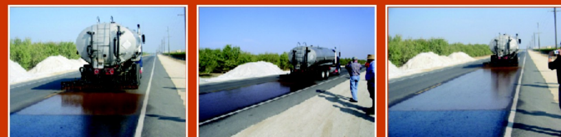
Aplikácia regeneračnej emulzie CRF za pomoci distribútora na mimomestskej komunikácii