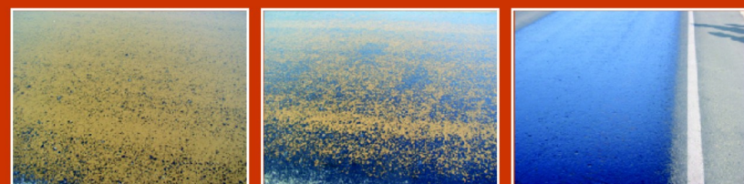
Zľava: 1. emulzia tesne po aplikácii; 2. emulzia reaguje; 3. emulzia je zreagovaná čierna farba