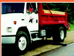
Vpracovanie piesku do povrchu prítláčnym kartáčom