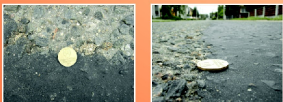
Rozdiel ošetrenej a neošetrenej cesty CRF aplikované v máji 2007 (fotka z júna 2007)

Regeneračná emulzia CRF je konkrétne navrhnutá pre vozovky, ktoré sú poškodené za bod, v ktorom by ešte pomohla malténová omladzovacia emulzia. Tieto typy vozoviek sa stali krehkými a vykazujú veľkú stratu jemného kameniva, olupovanie, a/lebo sieťové rozpady. Vozovky, ktoré majú príliš mnoho trhlín na to, aby sa utesňovali, ale ešte sú kandidátmi na mikrokoberec alebo prekrytie novou obrusnou vrstvou, sú ideálne pre ošetrenie hmotou CRF. CRF regeneračná emulzia je ekonomická a ľahko aplikovateľná alternatíva pre konvenčné ošetrenie povrchu, alebo môže byť použitá ako prípravné ošetrenie povrchu pre tieto metódy za účelom zredukovania reflexných trhlín. CRF regeneračná emulzia regeneruje stávajúci asfalt tým, že drží vrstvu pridávaného piesku na mieste, umožňujúc mu vyplniť veľké medzery a trhliny v ceste. Po použití je CRF pružné a odolné vo všetkých klimatických podmienkach. Kombinácia piesku/emulzie je zmiešaná a zapracovaná do povrchu automobilovou dopravou a postupom času a teploty vytvorí trvalé utesnenie.