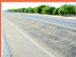
Vzhľad komunikácie tesne po aplikácii piesku