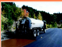
Aplikácia regeneračnej emulzie CRF za pomoci distribútora

Regeneračná emulzia CRF je aplikovaná postrekom z distribútora a následne je na takto ošetrený povrch nasypávaný piesok. Povrch je potom zarovnaný kartáčom, ktorý zároveň zatlačí piesok do trhlín a pórov. CRF regeneračná emulzia zrenovuje a utesní povrch a vytvára tak vozovku s dlhšou životnosťou.